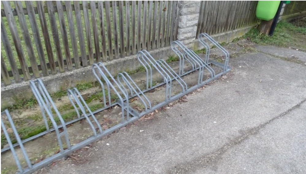
Ein Großteil der Abstellanlagen im Landkreis sind Vorderradhalter