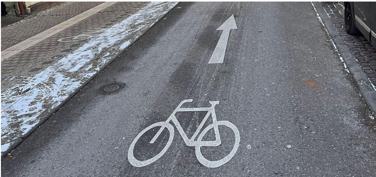
Beispiel einer Piktogrammkette

Um die Sicherheit für Radfahrende weiter zu erhöhen, untersucht das KUS gemeinsam mit den Kommunen und Baulastträgern den möglichen landkreisweiten Einsatz von Piktogrammketten. Eine erste Teststrecke soll ab 2026 in den Ortschaften Pörnbach, Puch und Langenbruck eingerichtet werden und aufzeigen, wie sich diese Maßnahme auf die Radverkehrssicherheit auswirkt. Bei einer positiven Entwicklung wird der Einsatz von weiteren Piktogrammketten auch in anderen Kommunen des Landkreises geprüft.