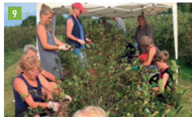
Bernhardstr. 3b, 85298 Scheyern-Fernhag