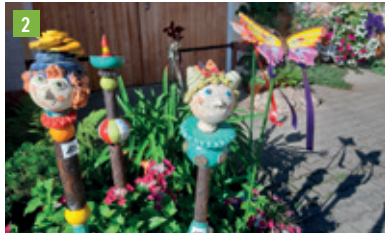
Münchener Straße 118, 85290 Geisenfeld