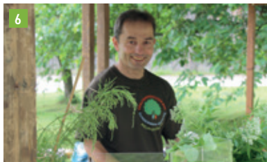
Ahornstr. 25, 86558 Hohenwart-Thierham