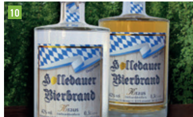
Eichenweg 14, 85305 Jetzendorf