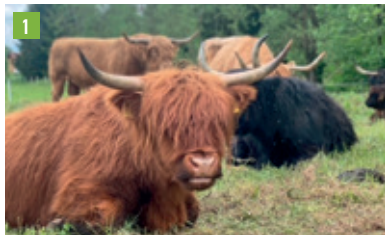
Thannbergstraße 24, 85084 Reichertshofen

Auf ausgewählten Radtouren unsere Heimat näher kennenlernen und hier die Vielfalt und Qualität regionaler Produkte erkunden: