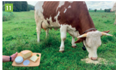
Ortsstraße 5, 85302 Gerolsbach