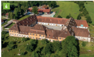
Prielhof 1, 85298 Scheyern