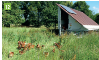
Stockhausen 1, 85302 Gerolsbach