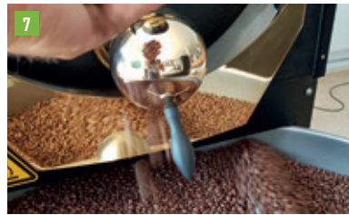
Raiffeisenstraße 18, 85276 Pfaffenhofen