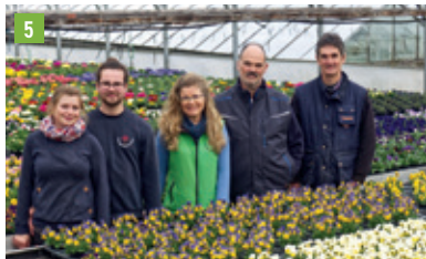
Blumenstraße 8, 85309 Pörsbach