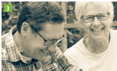
Unterschnatterbach 3, 85298 Scheyern