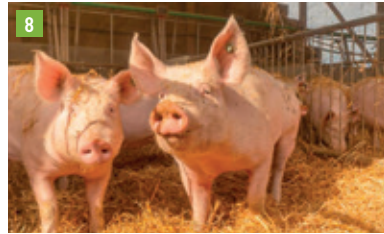
Thalhof 7, 85276 Pfaffenhofen